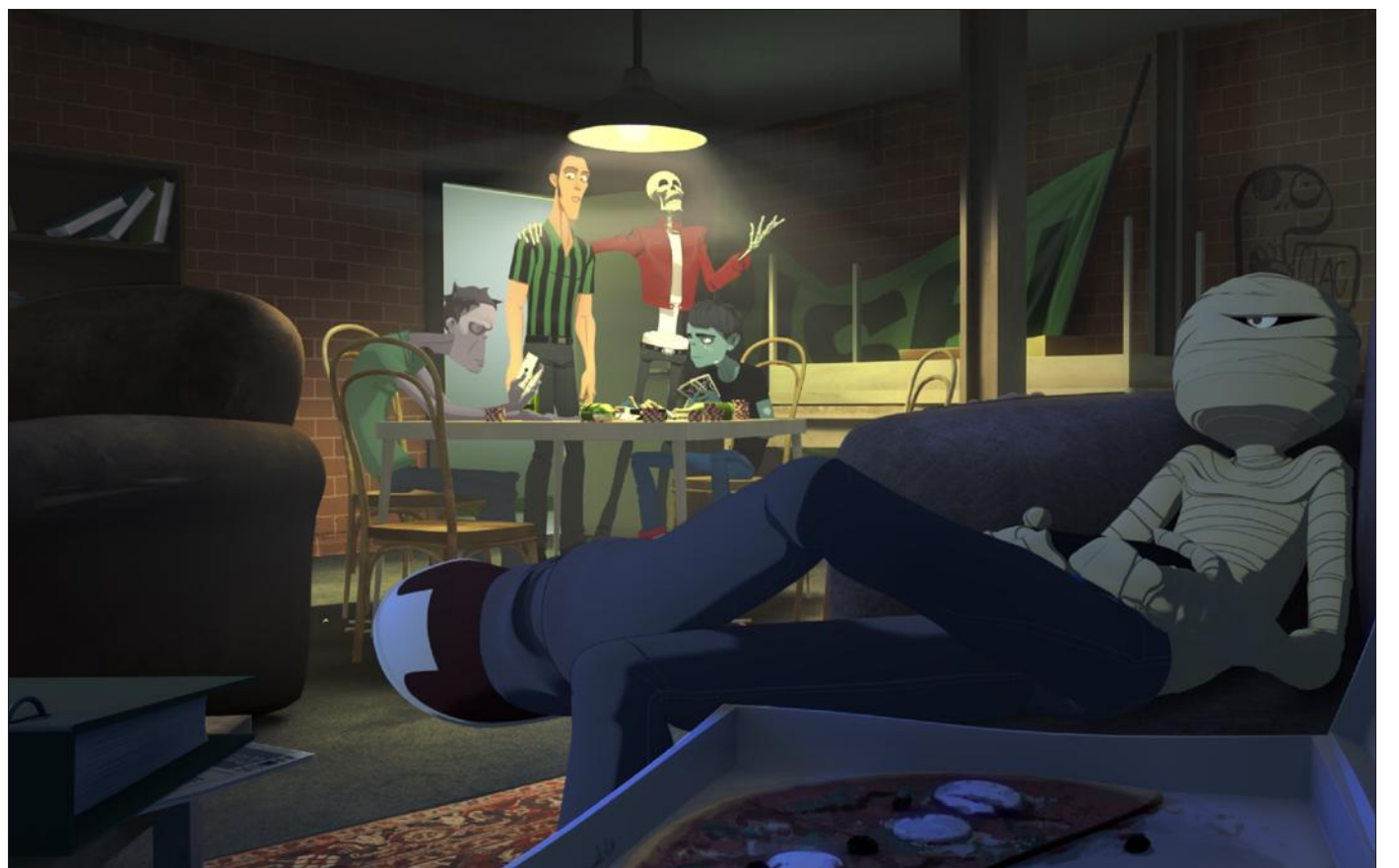
■ Le budget du film s'élève à 13,7M d'€.

Le plan prévoit entre autres la réalisation de plusieurs vidéos virales. Pas question pour l'heure d'en préciser le détail. « Le tour de force, c'est que le film sera réalisé en France à 85 %